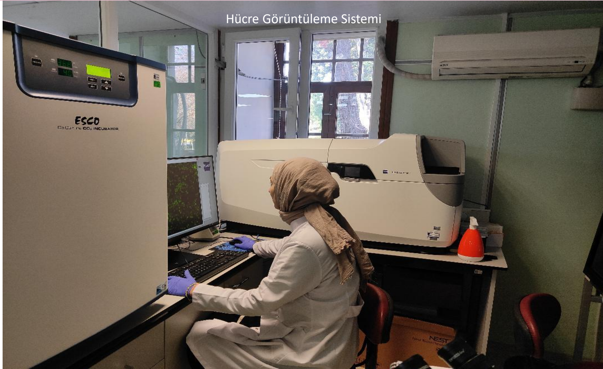
Hücre Görüntüleme Sistemi