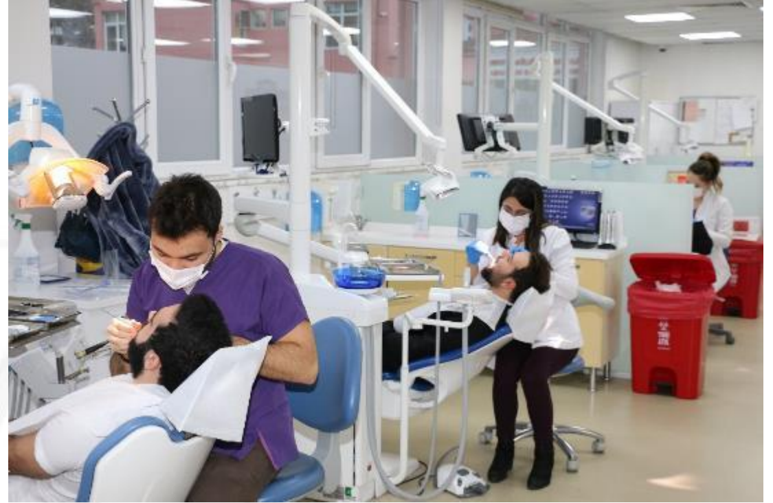
Restoratif Diş Tedavisi Kliniği