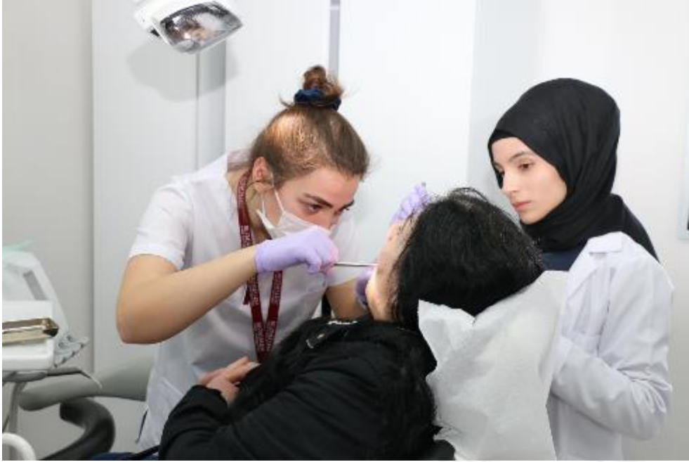
Ağız Diő ve ene Cerrahisi KliniĐi