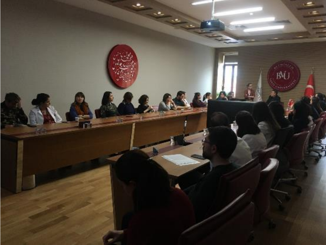
2019 Deęerlendirme Toplantı, 27 Aralık 2019