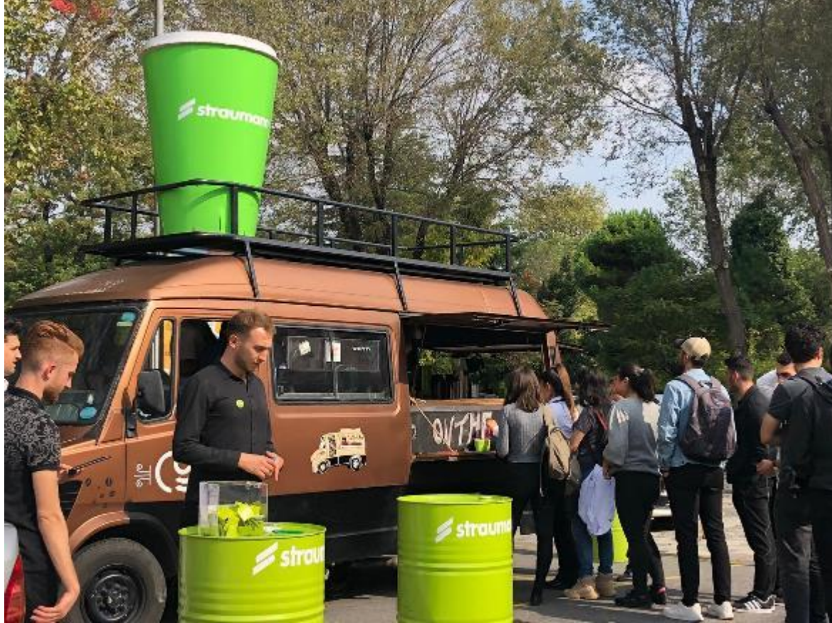
Kahve Karavanı - 17 Eylül 2019