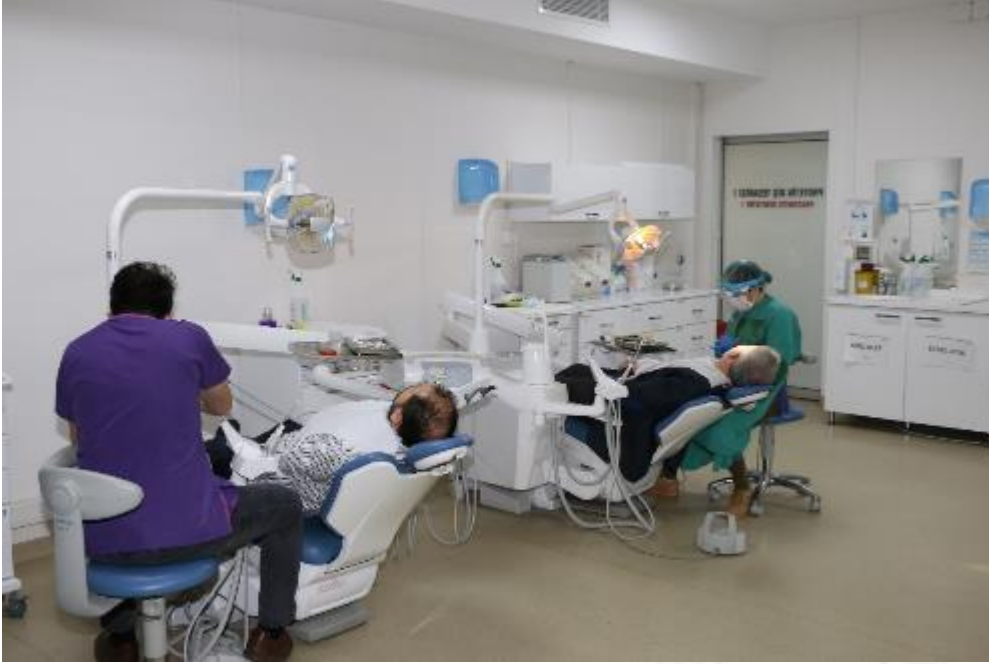
Protetik Diş Tedavisi Kliniği