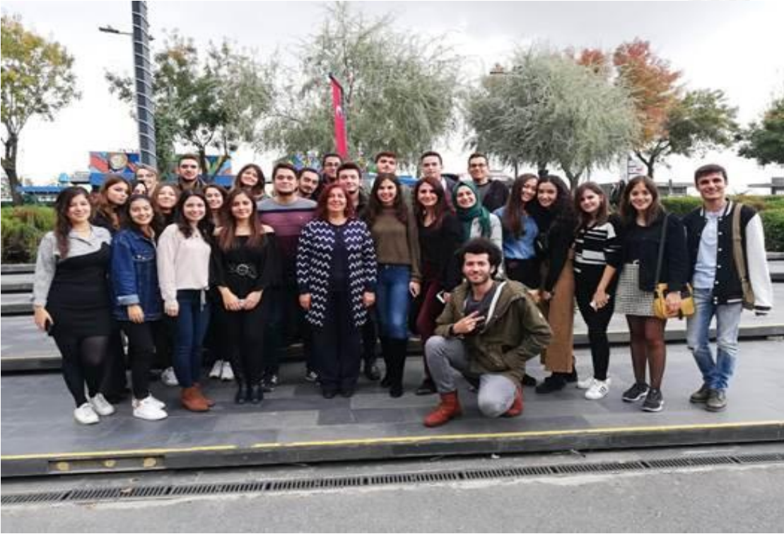
Öğrencilerimizle kahvaltı etkinliği sonrası