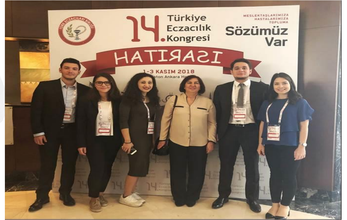
Öğrencilerimizle 14. Türkiye Eczacılık Kongresinde