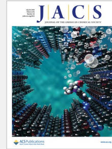
Journal of the American Chemical Society