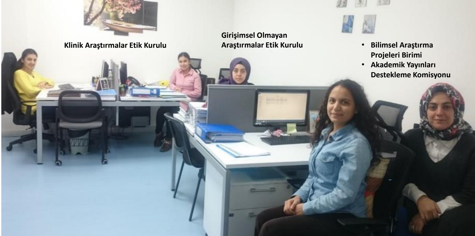
Klinik Araştırmalar Etik Kurulu